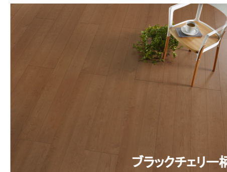
ブラックチェリー柄