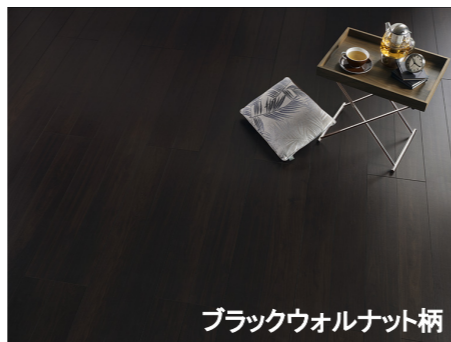
ブラックウォルナット柄