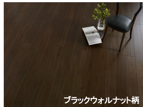
ブラックウォルナット柄